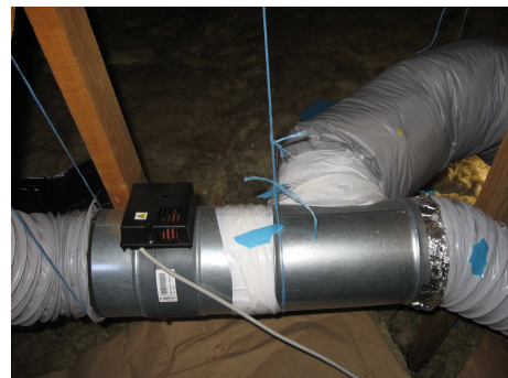
registre motorisé à calorifuger sauf le boîtier de commande