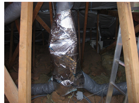
ventilateur solaire calorifugé