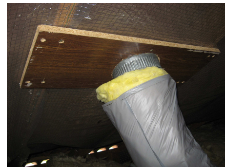
prise d'air de recyclage clouée ou vissée sous les fermettes