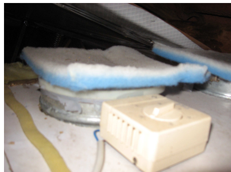
intérieur de la prise d'air d'insufflation avec filtre et thermostat TH1