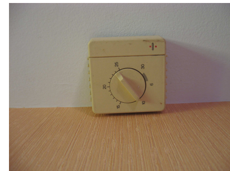
thermostat TH dans la partie habitation